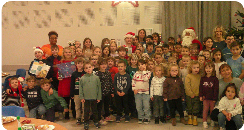
Le père Noël de

Les parents d'élèves et la coopérative scolaire de l'école Condorcet ont proposé aux Mirepeissetois la vente de sapins naturels. Pour cela les services techniques de la mairie ont récupéré les arbres le 5 décembre dans une sapinière de la Haute vallée de l'Aude. Les délégués de parents d'élèves de l'école ont assuré la distribution des sapins dans le parc des Platanes (50 sapins fraîchement coupés et conditionnés pour le transport)