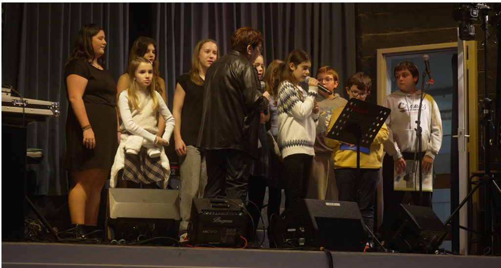
L'animation de la manifestation était assurée par l'école de chant, en partie par les enfants puis par les adultes. Une belle soirée !

Le lendemain, départ d'une marche découverte de l'histoire du village et de son église Saint-Sébastien, et en fin de matinée, la batucada Les Tambours de la Cesse a réalisé une sortie dans le parc des Platanes. L'après-midi a été consacrée sur le boulodrome de la Pépinière à l'habituel concours de pétanque du Téléthon organisé par la Boule de la Cesse.