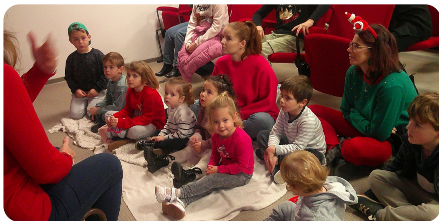
Le marché de Noël du comité des fêtes - La municipalité remercie et félicite les membres du Comité

Les parents d'élèves et la coopérative scolaire de l'école Condorcet ont proposé aux Mirepeissetois la vente de sapins naturels. Pour cela les services techniques de la mairie ont récupéré les arbres le 5 décembre dans une sapinière de la Haute vallée de l'Aude. Les délégués de parents d'élèves de l'école ont assuré la distribution des sapins dans le parc des Platanes (50 sapins fraîchement coupés et conditionnés pour le transport)