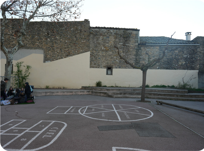
Peinture du mur de l'école