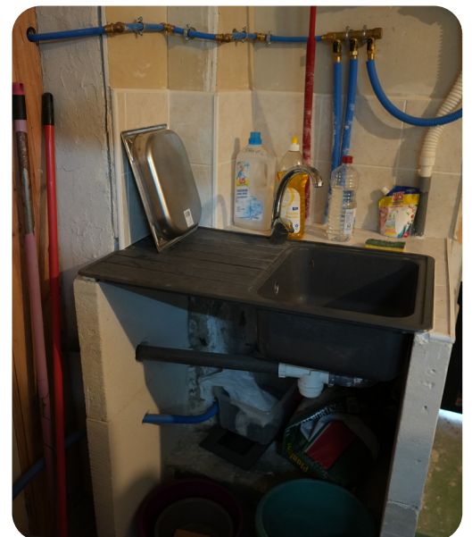
Installation sanitaire de l'épicerie