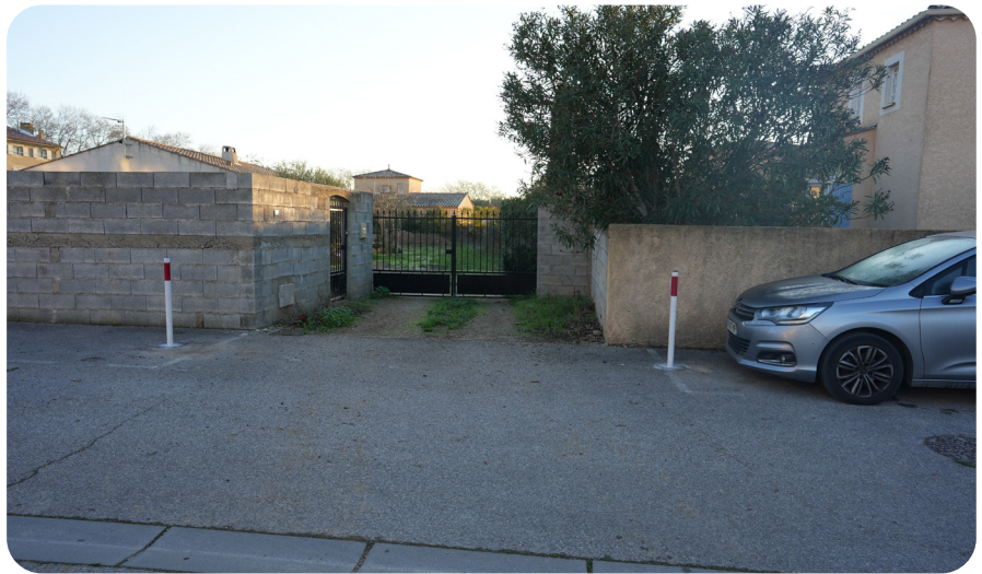
Pose de matériel de gestion du stationnement