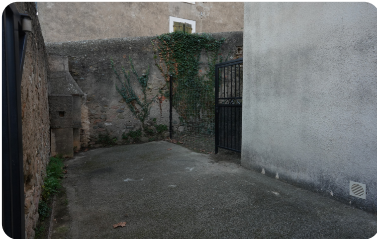
Installation d'une grille de sécurité pour le puit de l'ancien local des infirmières (sous la Poste)